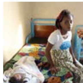
Ett nyfött barn skall vaccineras med de första doserna.

Till ytan är provinsen lika stor som en tredjedel av Sverige. Den ligger otillgängligt utan farbara transportvägar. Den enda möjligheten att få in vaccinet är därför via flyg, båt och motorcykel. Läkarmissionen har