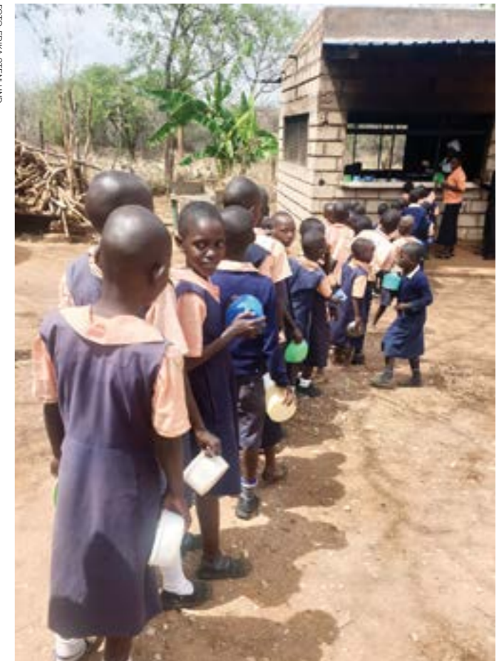
I skolprojektet i Tharaka får barnen skollunch som består av majs och bönor.