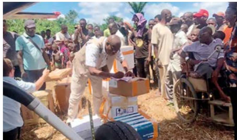
Planet töms på lasten. Leveransen kontrolleras noga och dokument signeras vid överlämnandet av vacciner och material på landningsbanan i Mimia.