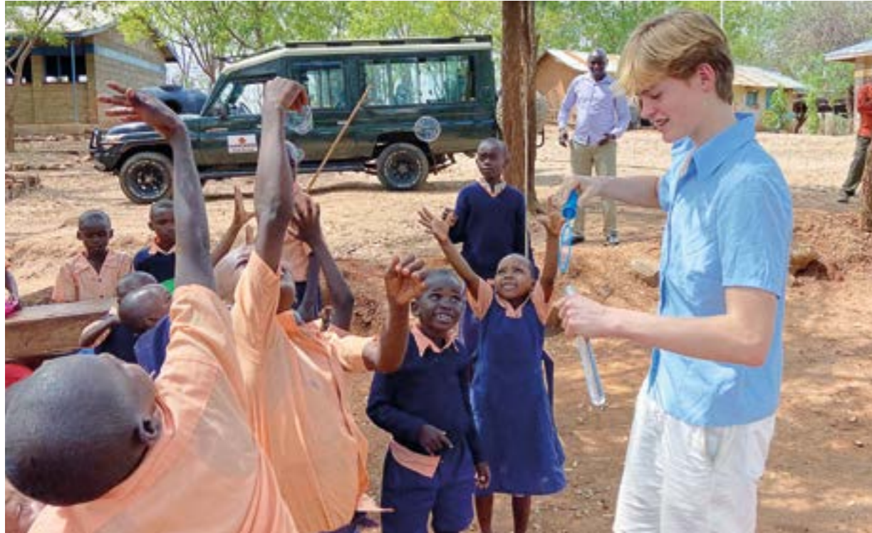
Vid Tures första resa till Tharaka var han bara 7 år. Idag är han 17 år och resorna har satt djupa spår i honom.

man chilla lite men det går inte att säcka ihop helt. Alla behövs, säger han.