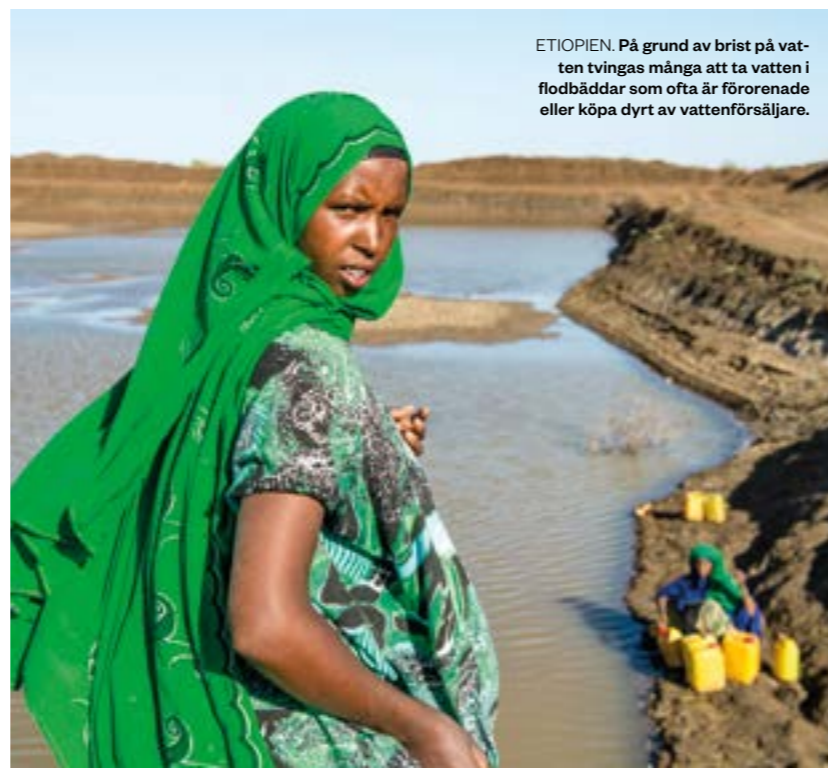
ETIOPIEN. På grund av brist på vatten tvingas många att ta vatten i flodbäddar som ofta är förorenade eller köpa dyrt av vattenförsäljare.