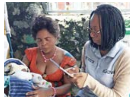
Med den digitala registreringen av nyföddas data blir det enklare att i framtiden styra hälsoinsatserna.

Projektet har startat på Kyesherosjukhuset i Goma, och målet är att det ska utvidgas till hela provinsen.