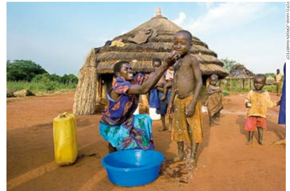
UGANDA. Ansvar för att hämta vatten ligger oftast på kvinnor och flickor, vilket gör att många inte har tid eller möjlighet att gå i skolan.