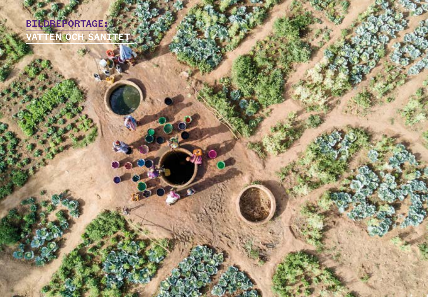
NIGER. Klimatförändringarnas extremväder i form av bland annat torka, drabbar samhällen hårt. Brunnen som kan ge vatten till odling är därför en förutsättning för matförsörjning för många.