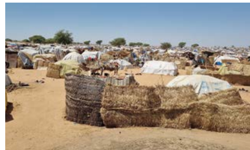
TCHAD. I flyktinglägret Adre, ett transitläger på gränsen till Sudan, befinner sig 160 000 människor på flykt från stridigheterna. Läkarmissionen arbetar med att förbättra förhållandena inom vatten och sanitet i 14 flyktingläger i östra Tchad.