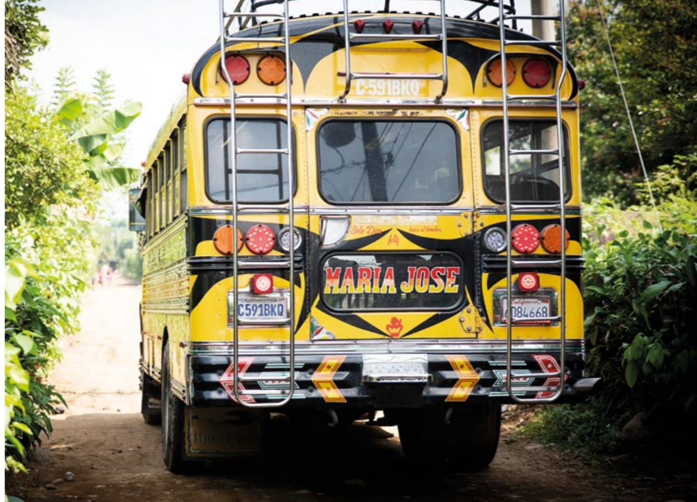
Varje buss i byn har ett eget namn. Här Maria José. Det finns inga hållplatser, det är bara att ställa sig vid väggkanten och hoppa på när bussen kommer.