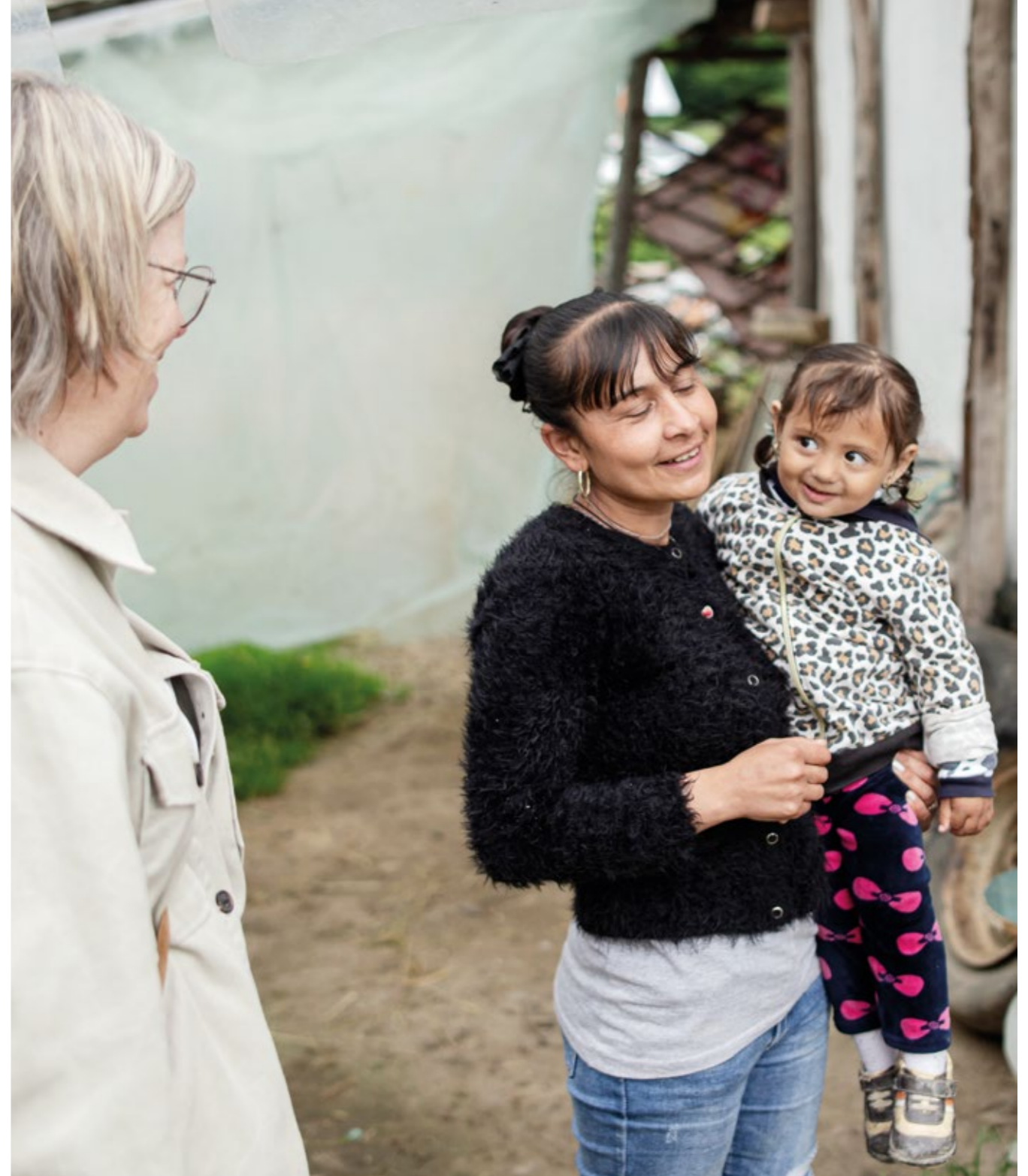
Stojara har hela sin släkt i byn, men nu flyttar familjen för att bo mer centralt i samhället.