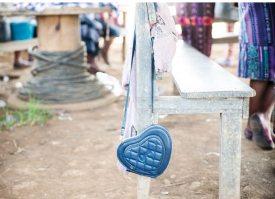
I Guatemala har alla medborgare laglig rätt att ta del av viktiga myndighetsdokument. Men inte många ur Mayabefolkningen är medvetna om sina rättigheter.