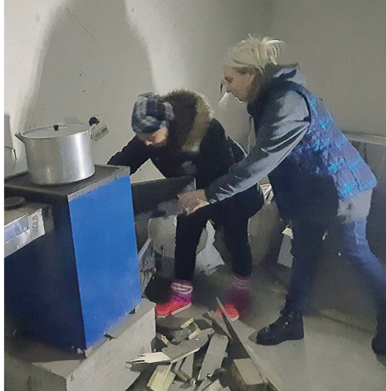
Matlagning blev en utmaning när elen slogs ut i Ukraina.

– Om jag sa att jag mådde bra skulle jag inte tala san- ning. Men vi försöker att inte låta allt handla om kriget. Barnen får komma hit och