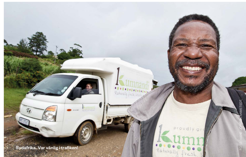
Sydafrika. Var vänlig i trafiken!