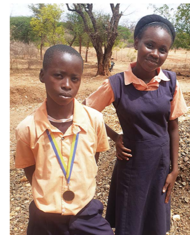
Syskonen Titus och Aohippy är vana att vara hungriga, i alla fall på helgerna.