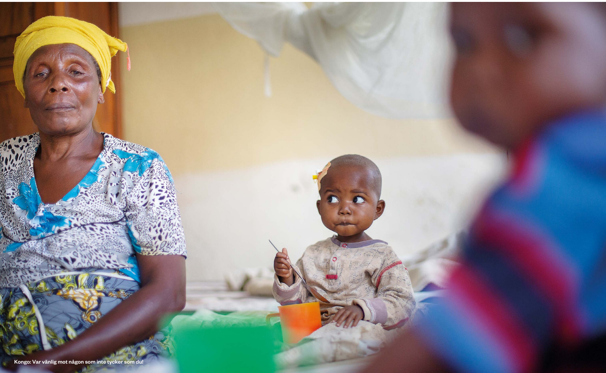
Kongo. Var vänlig mot någon som inte tycker som du!