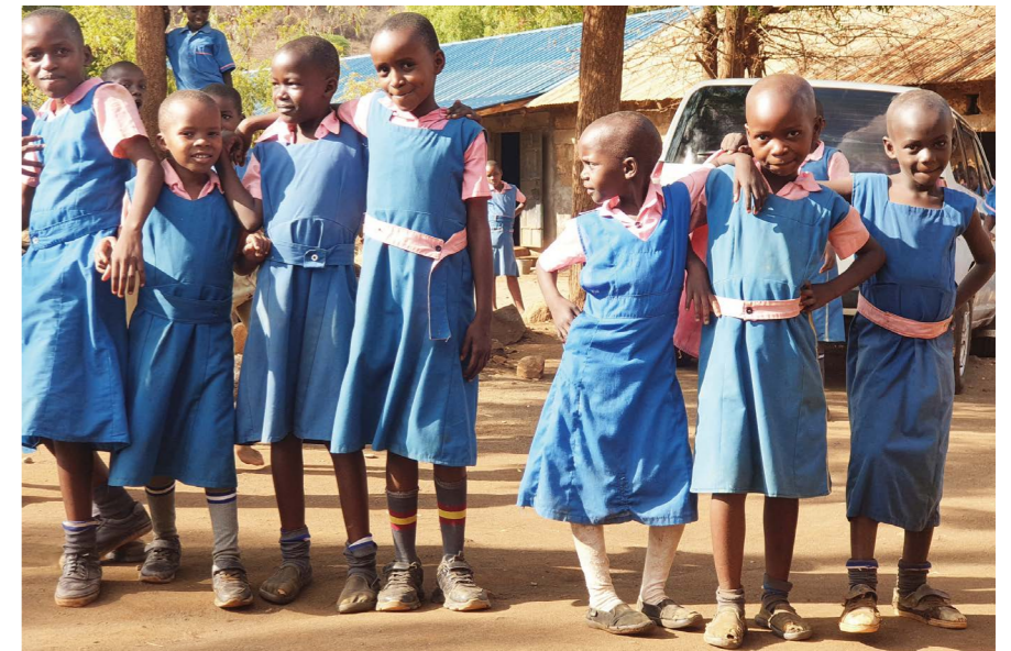
Friskare barn och bättre skolresultat är tydliga effekter av skolmatsprojektet.