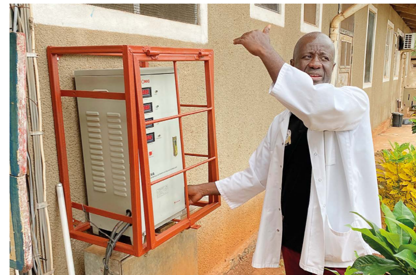
Under september 2022 installerades solpaneler på sjukhuset för att ge tillförlitlig el.