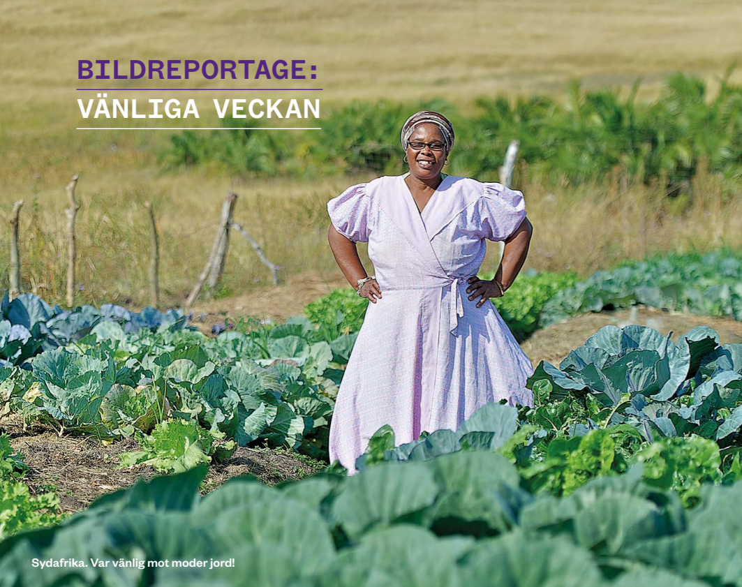
Sydafrika. Var vänlig mot moder jord!