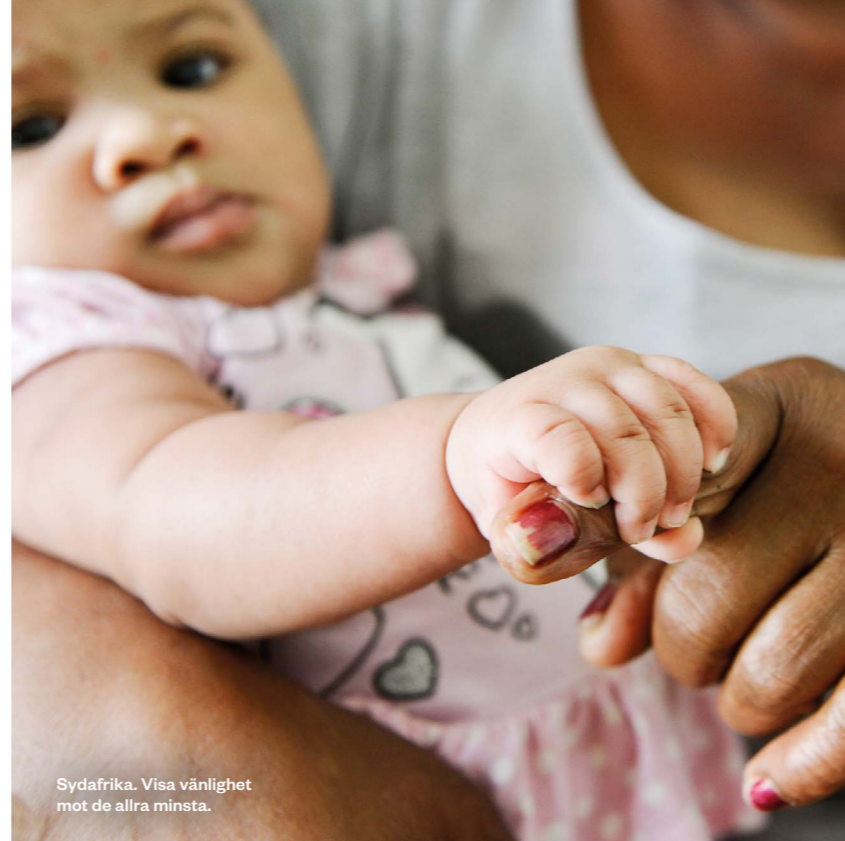
Sydafrika. Visa vänlighet mot de allra minsta.