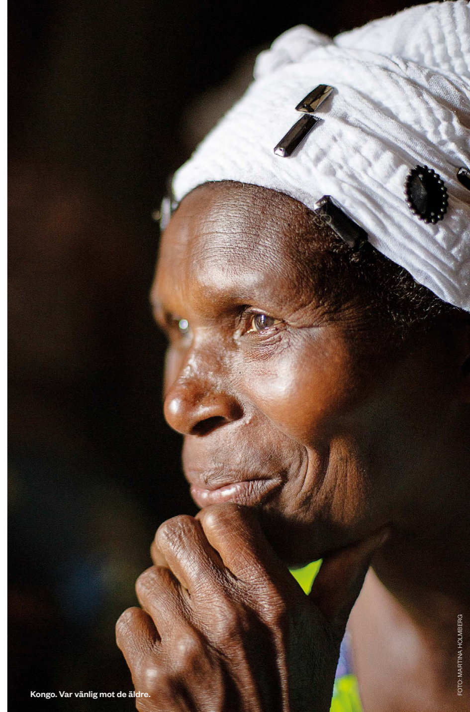
Kongo. Var vänlig mot de äldre.