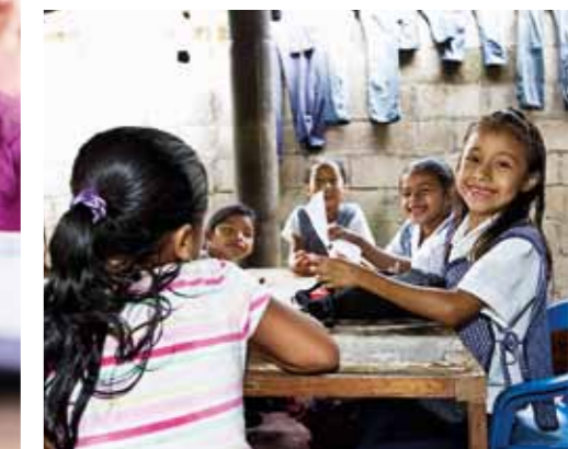
Förskolor i Centralamerika, 230 kr.