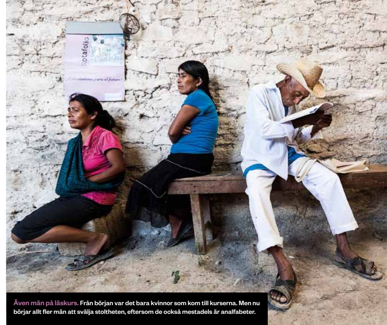
Även män på läskurs. Från början var det bara kvinnor som kom till kurserna. Men nu börjar allt fler män att svälja stoltheten, eftersom de också mestadels är analfabeter.