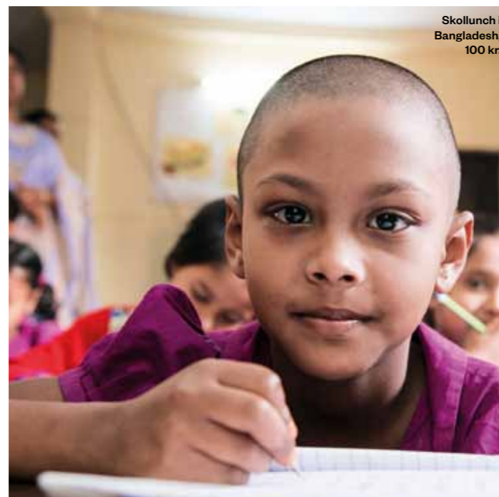
Skollunch i Bangladesh, 100 kr.