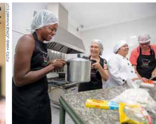
Kockutbildning i Brasilien, 85 kr.