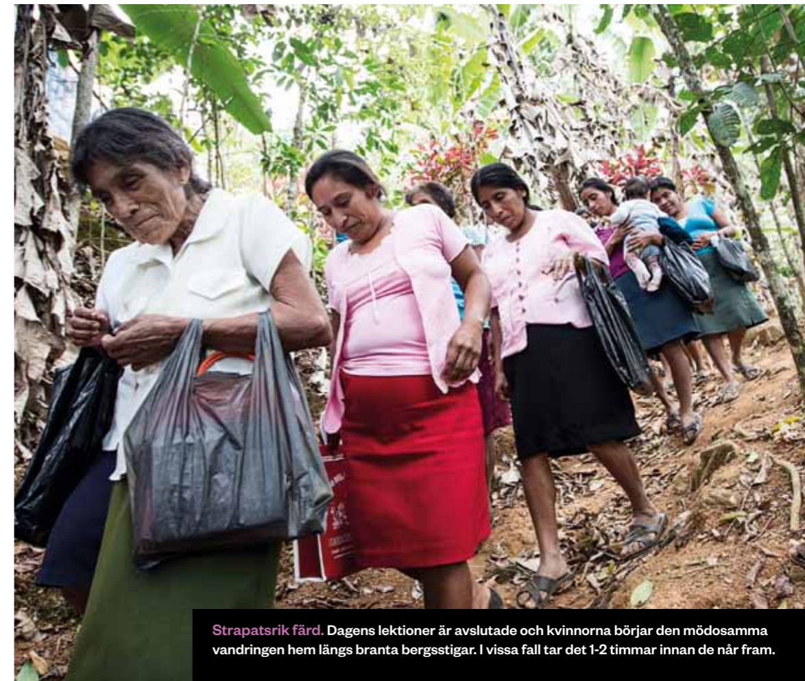
Strapatsrik färd. Dagens lektioner är avslutade och kvinnorna börjar den mödosamma vandringen hem längs branta bergsstigar. I vissa fall tar det 1-2 timmar innan de når fram.