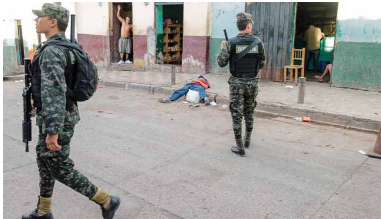
Militärpolis på patrull i ett av många våldsamma och socialt utsatta områden i Honduras huvudstad Tegucigalpa.

ras. Här finns ju massor av politiker och tjänstemän som går att köpa, och kommer narkotika in i ett land i den här omfattningen ökar också våldet lavinartat.