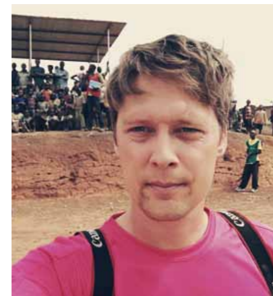
Fotografen Tomas Ohlsson skildrar världen och dess människor genom sin kamera.