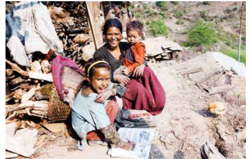
De hade aldrig tidigare sett en kamera, och plötsligt var de i centrum. Det är nog därför de ser så glada ut. Samtidigt, ovanför mig på taket till vänster står 40 personer och tittar på när jag fotar, i en by med cirka 200 personer. Och så kommer den där lilla kycklingen gående.

– Ett helt annat sätt, de kändisar jag fotar är beredda på det. De ska intervjuas för någon tidning, och de vet varför jag är där. När jag är ute i ett flyktingläger så är jag först och främst