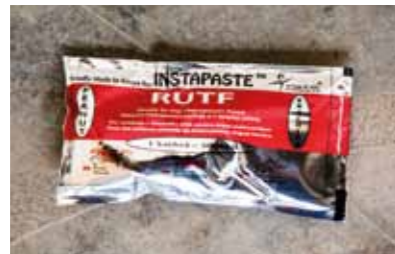
Plumpy nuts – jordnötspastan som kan vara skillnaden mellan liv och död.