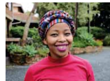
Sne är en av de första tjejerna som kom till GCF. Hon jobbar på centret sedan mars 2017.

"Den här platsen är allt för mig! Den är det första stället där jag kände att livet inte bara är dåligt. Den här platsen har räddat mig, om och om igen."