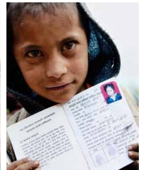
Bilden är tagen i Nepal. Flickan på bilden har ett medfött förståndshandikapp och det hon visar är det bevis som hon har fått som berättar om hennes tillstånd och som gör att hon och hennes mamma kan få hjälp.

där som människa. Jag väntar med att plocka upp kameran tills de vet vem jag är, kanske sätter jag mig ner och pratar så att de får förtroende för mig.