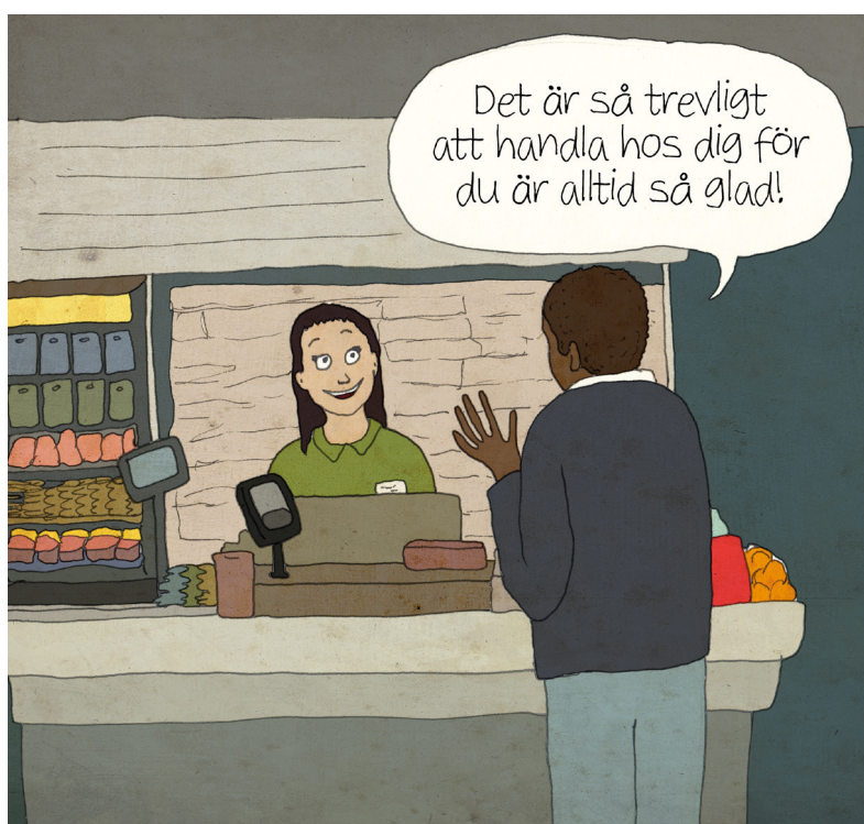
Illustration: Louise Winblad/Hej hej vardag