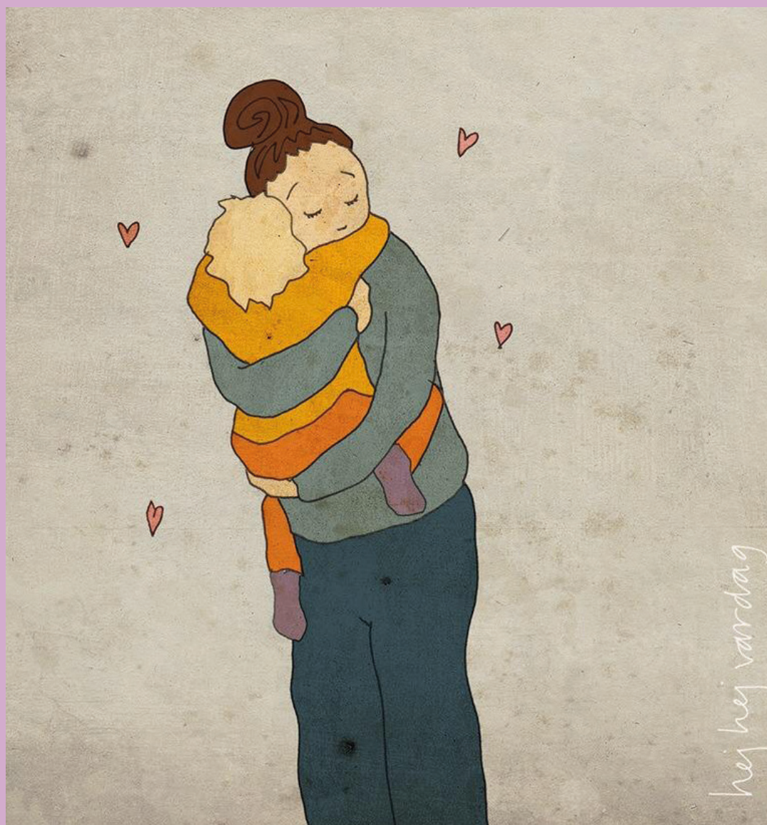
Illustration: Louise Winblad/Hej hej vardag