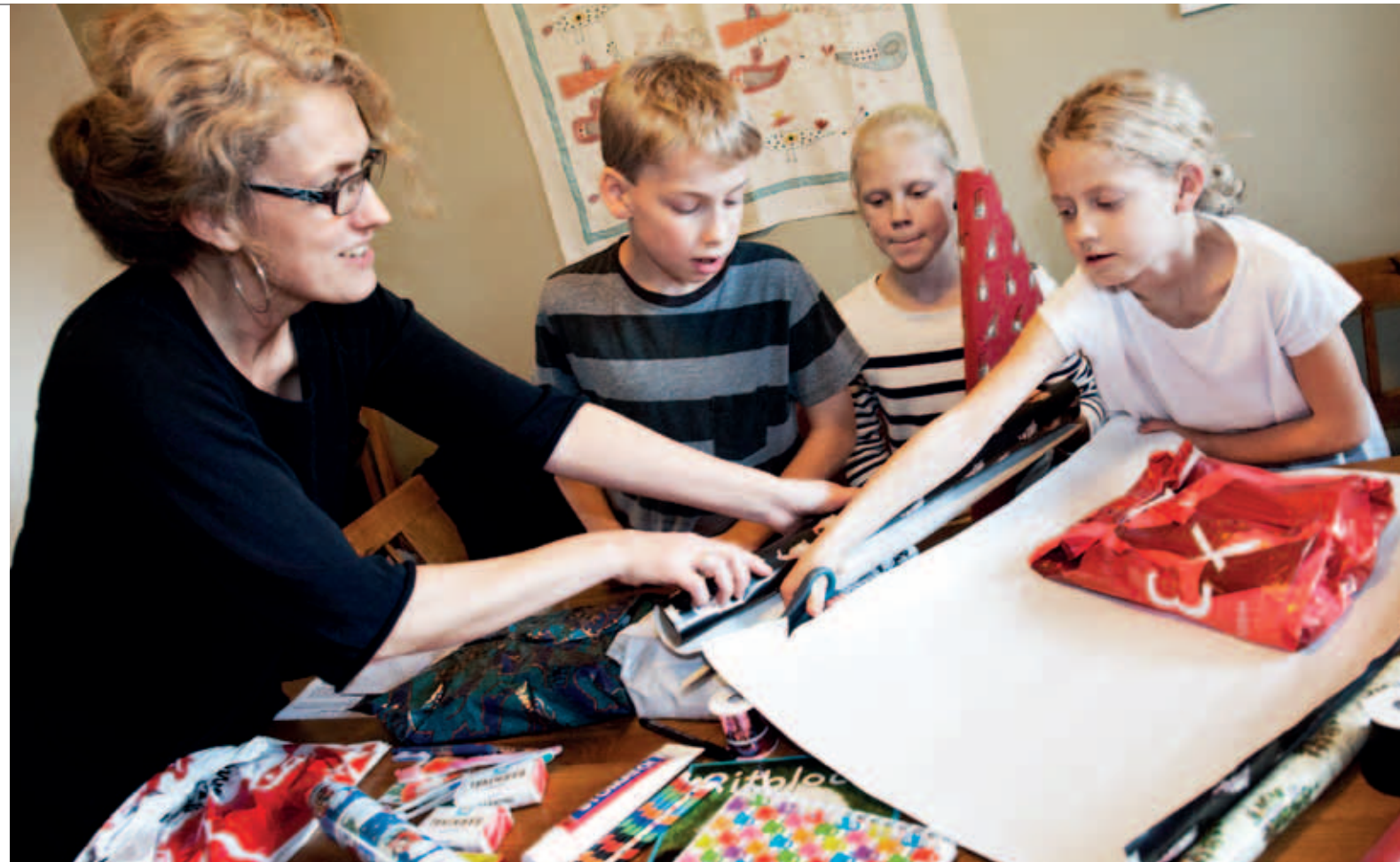
Familjen Magnusson bjöd in sina grannar till adventsfika och julklappsinslagning.