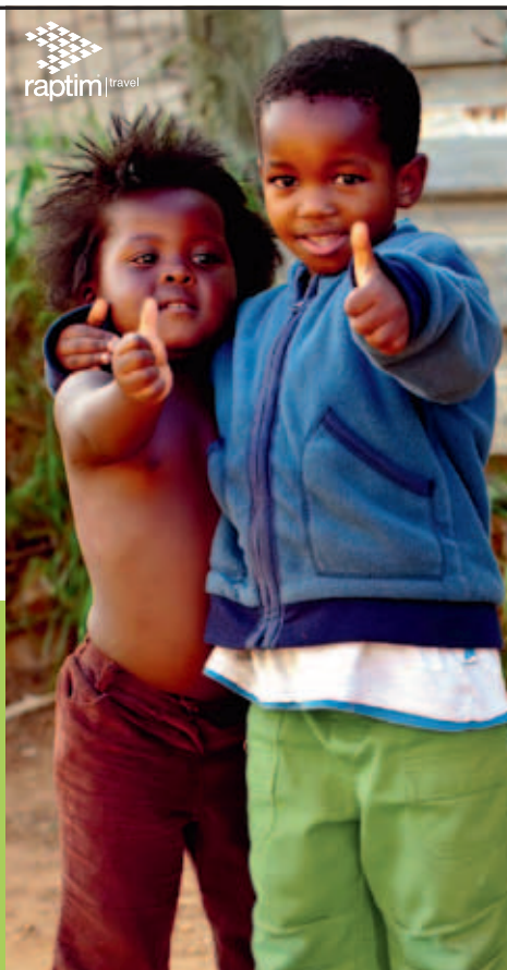
raptim | travel

Europa: 0140-37 50 30 Afrika: 0140-37 50 10 Övriga Världen: 0140-37 50 20 info@tranås-resebyrå.se www.tranås-resebyrå.se