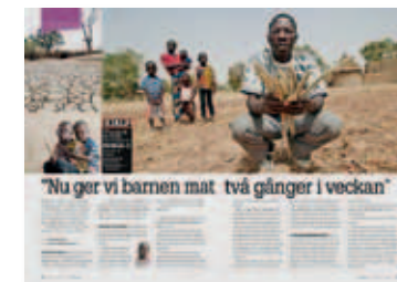
Svenska Journalen, april 2012.