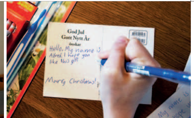
Varje julklapp har en personlig hälsning.