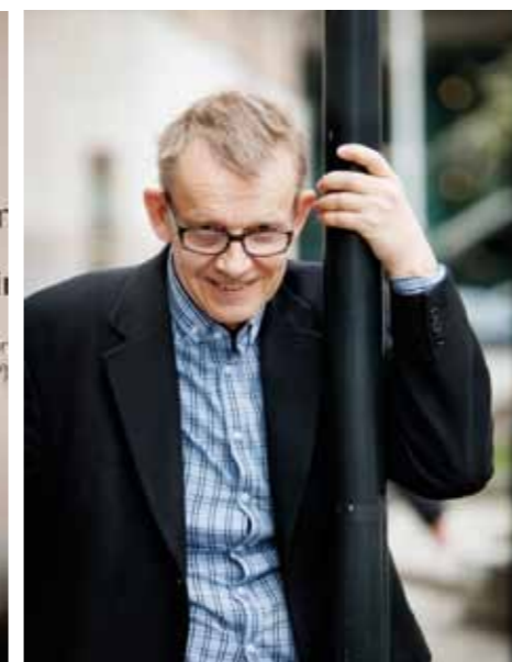
Hans Rosling höll ett uppskattat seminarium.