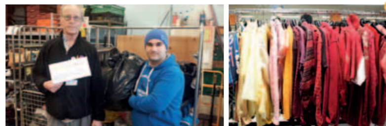
I butiken i Västerås tog man hand om stora mängder kläder.