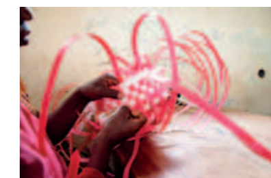
Korgflätning ingår som en del i terapin för de kvinnor som har vårdats på Panzisjukhuset.

■ Ett hundratal nomineringar av vänliga personer kom in till Läkarmissionens facebook-applikation – där man kunde uppmärksamma de som gjort fina saker i vardagen. Några av de som var med och nominerade fick ett värdefullt "pris": sjalar vävda av befriade barnslavar i Etiopien och korgar flätade av kvinnor som vårdats på Panzi-sjukhuset i Kongo.