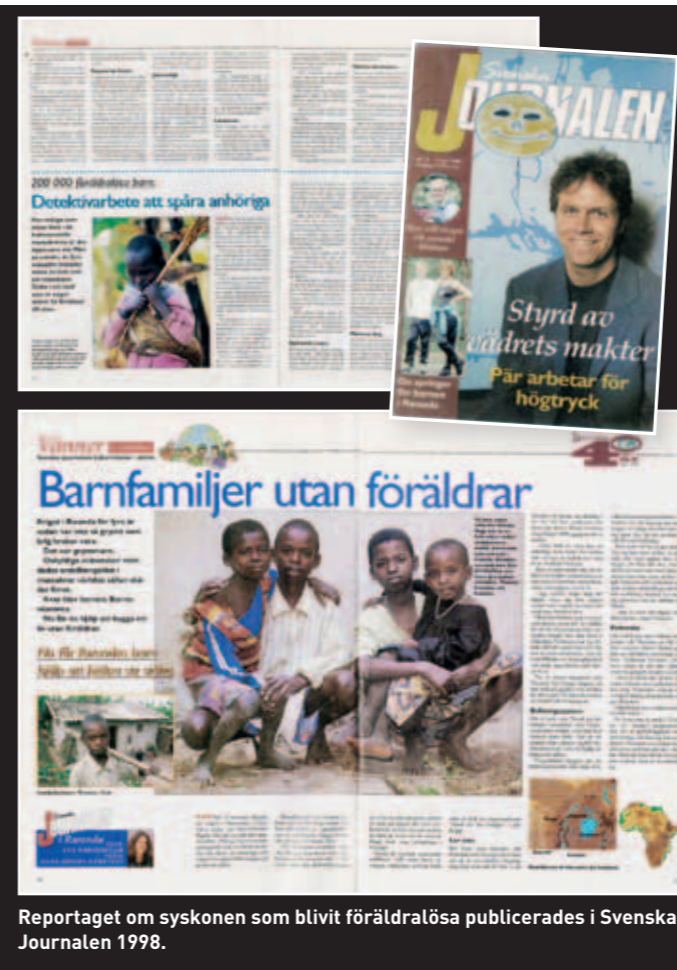
Reportaget om syskonen som blivit föräldralösa publicerades i Svenska Journalen 1998.