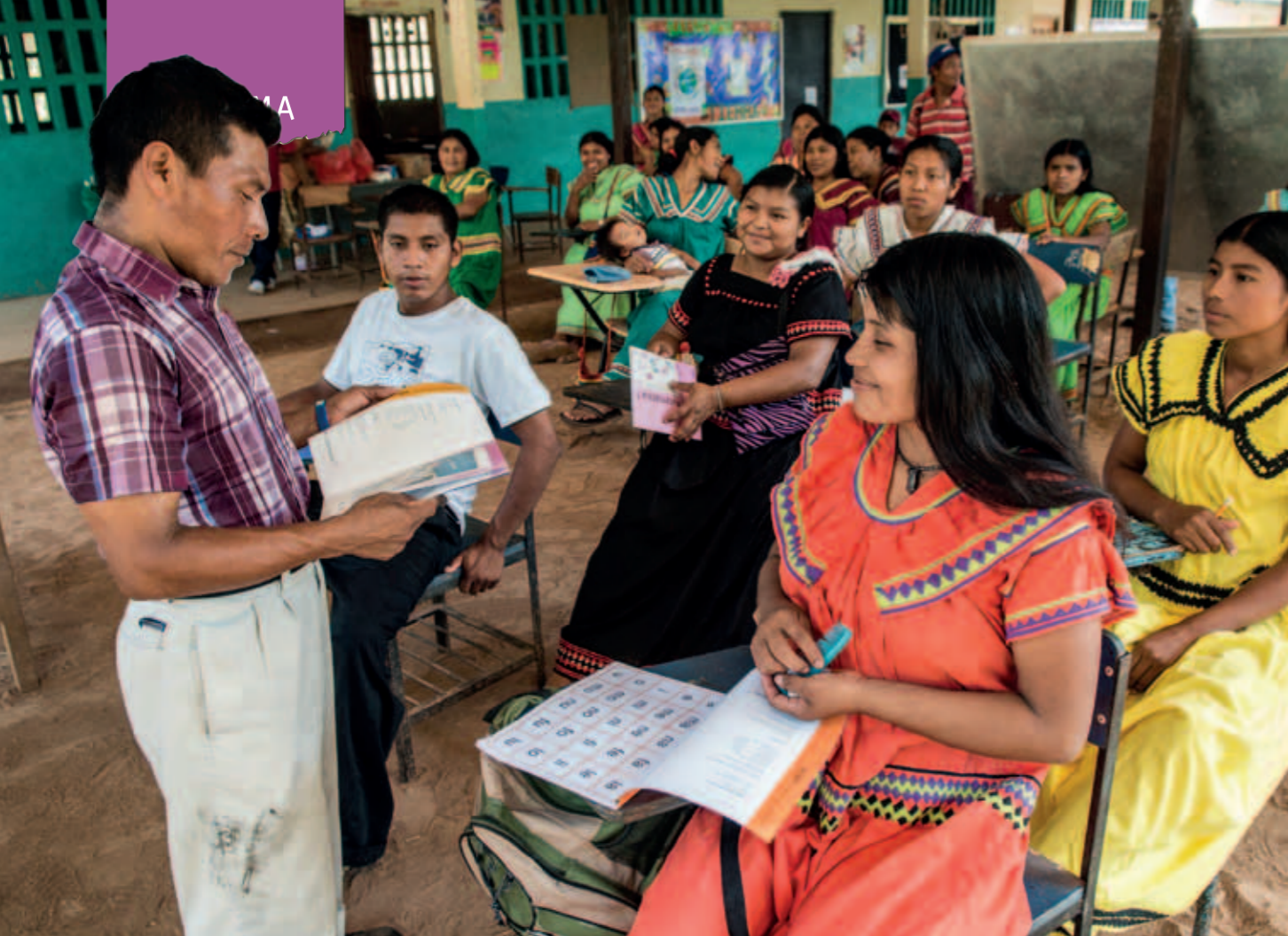
Det är alltid mest kvinnor i alfabetiseringskurser. Ofta fick deras bröder gå i skola som barn medan de själva hjälpte till hemma.