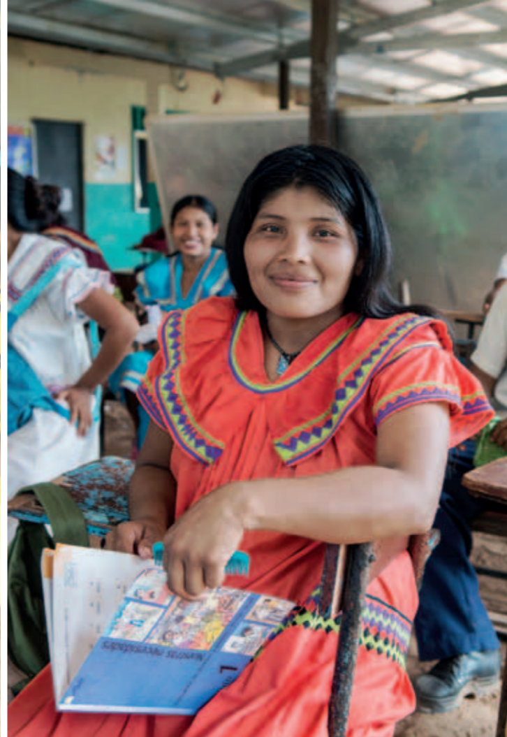
Domecilia behöver färdigheter både för det moderna och traditionella livet. Att gå läskursen är det viktigaste hon gjort i sitt liv, så här långt, säger hon.