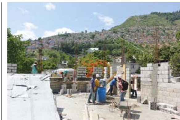
Återuppbyggnad av bostäder.

Den första katastrofhjälp bestod mestadels av hjälp med hygien/sanitet och enklare byggnadsmaterial (rep, presenning etc) till dem som drabbats av den kraftiga orkanen. Nu kommer vi även att kunna hjälpa till med viss återuppbyggnad av bostäder.