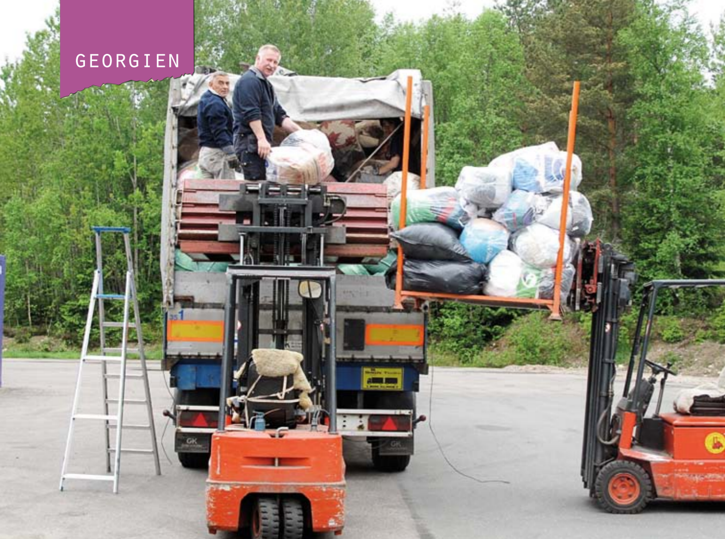
Under 2016 skickades 2 228 ton sjukvårdsmaterial, textilier och pryglar från Human Bridge till olika länder i Afrika, östra Europa och Mellanöstern.

Hon visar mig bilder på en pojke och en flicka som fått varsin rullstol. Även om georgiska staten säger sig bistå handikappade med vad de behöver, räcker inte alltid löftena hela vägen fram.