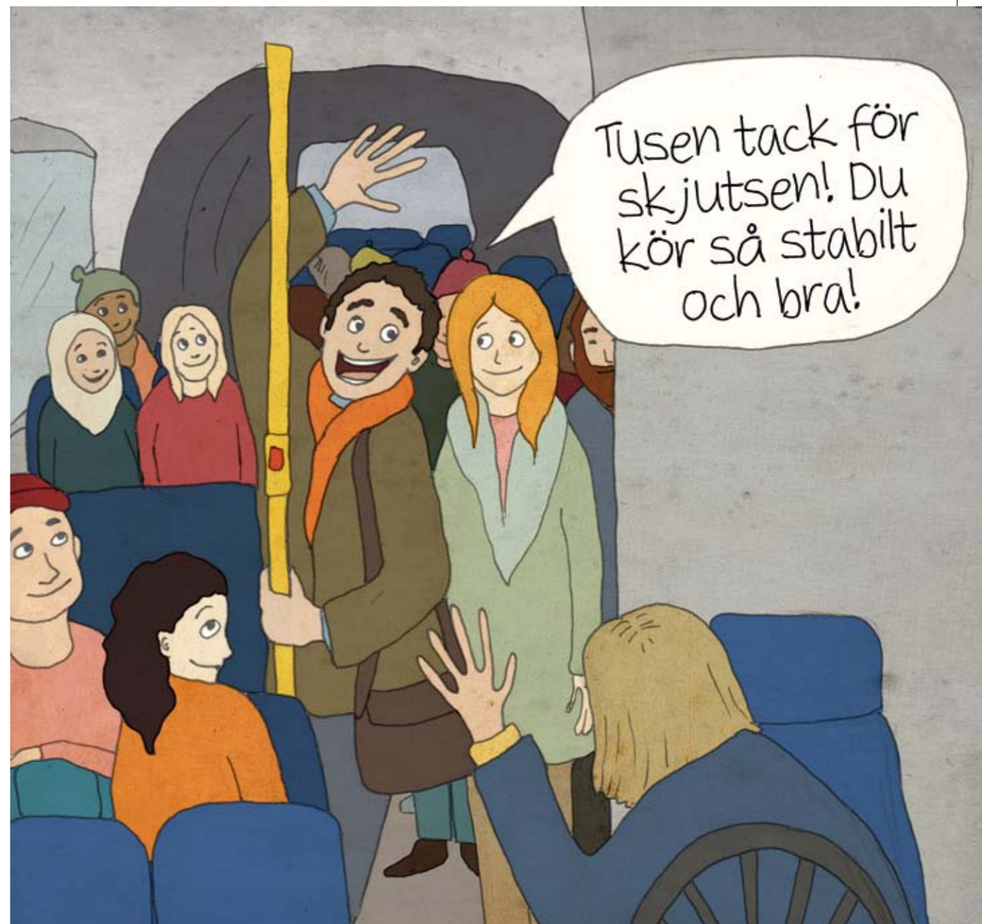
Utöver att det gör andra gott när vi är hjälpsamma och vänliga, och att det ger en känsla av välmående, så bidrar det även till stora hälsoeffekter. Så satsa mer på vänlighet.

– Ja, det kan vara ett litet steg bland många som utan tvekan kan göra stor skillnad. ■