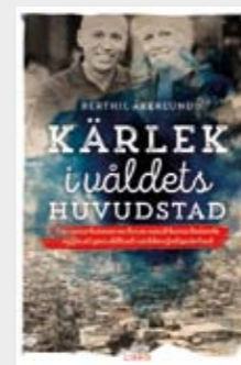
Boken "Kärlek i våldets huvudstad" utspelar sig i ett av världens farligaste länder, med nära 7 000 mord om året.

Mannen tog med Alicia bort från stationen och in på en sidogata. Hon frågade vad han ville, men han svarade inte.