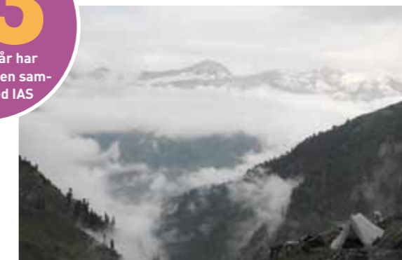
Läkarmissionen ger stöd till denna mobila skola där läraren flyttar med familjerna och barnen lär sig läsa och skriva och får en helt annan möjlighet än deras föräldrar fick.

I så många år har Läkarmissionen samarbetat med IAS