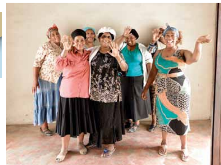
Stödgrupp för GCF-föräldrar i Izingolweni.